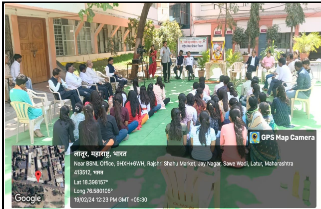
Student, teaching and non-teaching staff participated in the Chhatrapati Shivaji Maharaj jayanti programme.